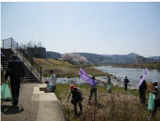
4月のパトロールの様子

昨年10月、第2次美化推進重点地区として記念橋から国長橋までの兩岸が指定されました。