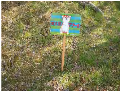
犬フンの多いところには看板を設置しました

堤防内は広々としていて開放感がありますが、市民共用の大事な憩いの場です。まちの美化に市民一人ひとりのマナーアップが望まれます。 【落合】