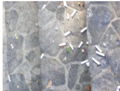
タバコの吸い殻も多く捨てられています