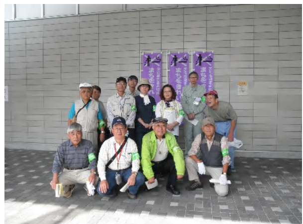
啓発終了、参加の皆さんで記念撮影