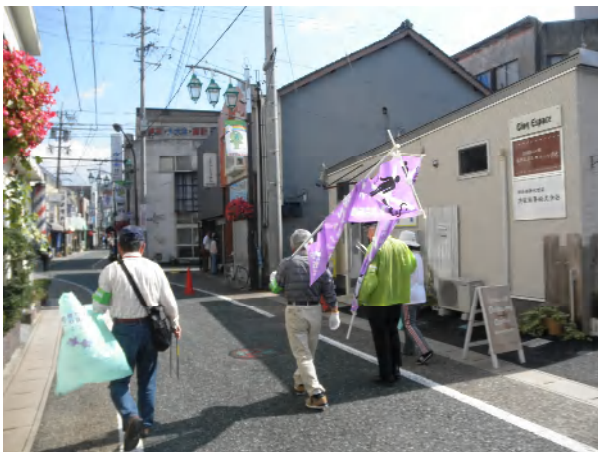
ながせ通りの様子、花も道路もきれいです

JR多治見駅南口からながせ通りを経て、多治見橋から陶都大橋の県道を経てJR多治見駅に戻るコース約3kmを巡回しました。